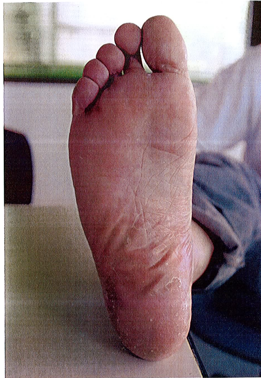
H17年7月10日 履いて10日目 水虫に対するテスト