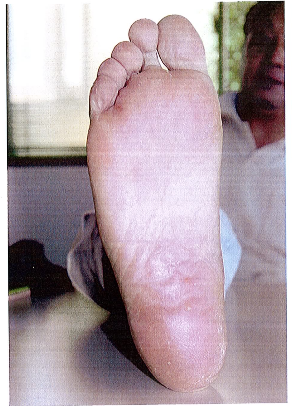
H17年7月30日 履いて30日目 水虫に対するテスト